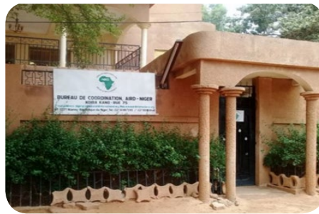
À gauche: une partie de l'équipe AIRD Niger À droite: le bureau de coordination de Niamey

Le HCR signale que la population des personnes relevant de la compétence du HCR au Niger en décembre 2019 est de 439 686 personnes présentes principalement dans les régions de Tillabéri, Tahoua, Maradi, Agadez, Diffa et Ouallam. Il s'agit d'environ 180 000 réfugiés ainsi que d'autres bénéficiaires, notamment des demandeurs d'asile, des personnes déplacées et des rapatriés. La plupart de ces réfugiés sont originaires du Nigéria, du Mali, du Tchad, de la République démocratique du Congo, de la République centrafricaine et de la Côte d'Ivoire. AIRD Niger opère dans ces régions qui partagent des frontières avec des pays en proie à des conflits internes. Ces zones d'opérations ont souvent enregistré plusieurs attaques armées, comme à Diffa et Tillabéri, faisant plusieurs victimes. Ces situations rendent ces zones dangereuses pour les travailleurs humanitaires, les populations hôtes et les personnes déplacées. Depuis l'établissement et la signature d'un accord de partenariat avec le HCR Niger, le programme a aidé à fournir des services au HCR et à ses partenaires liés à; Gestion du transport, entreposage, gestion d'atelier, gestion de flotte et gestion de carburant.