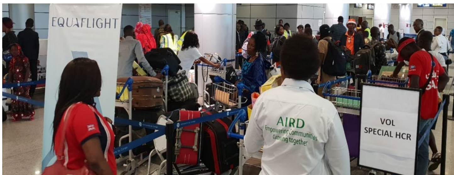
Ci-dessus: récent exercice de rapatriement de réfugiés centrafricains à l’aéroport Maya-Maya de Brazzaville, République du Congo.

Le dernier trimestre de 2019 a marqué la fin d’une décennie et le temps de réfléchir aux succès et aux défis de cette période. Alors que nous entrons dans une nouvelle décennie, nous reconnaissons que, malgré les efforts considérables déployés pour faire du monde un meilleur endroit où vivre, en particulier pour les personnes déplacées, il reste encore beaucoup à faire. Et nous reconnaissons également que cette nouvelle décennie nécessitera une nouvelle réflexion radicale pour résoudre certains des problèmes urgents auxquels nous sommes confrontés à l’échelle mondiale tels que le changement climatique. La protection de notre environnement pour les générations futures doit être une priorité. Beaucoup de personnes qui seront les plus touchées par le changement climatique et la dégradation de l’environnement sont les personnes déplacées et les communautés d’accueil que nous desservons. Notre façon de travailler ne doit pas aggraver le problème, mais doit laisser un monde meilleur, même si nous continuons à fournir une large gamme de solutions à court, moyen et long terme pour les personnes relevant de la compétence du HCR dans différents secteurs.