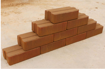
Ci-dessus: La nature imbriquée des briques Hydraform qui minimise le besoin de mélange de mortier.

La construction est une activité clé que AIRD entreprend dans toutes ses opérations. Trouver de nouvelles façons d'améliorer la façon dont nous faisons les choses mieux, plus rapidement et à moindre coût est toujours le bienvenu. En Tanzanie, une nouvelle façon de mieux construire les bâtiments est en cours grâce à l'introduction de briques Hydraform. Les briques Hydraform sont faites de murram et de ciment et sont imbriquées les unes aux autres de manière à minimiser le besoin de mélange de mortier (ciment, sable et eau). Cela peut réduire les coûts de construction de projets jusqu'à 25%.