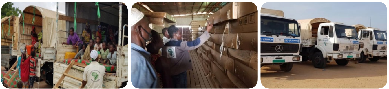
Le transport des réfugiés, la gestion de l'entrepôt des articles non alimentaires et la gestion de la flotte ne sont que quelques-unes des activités que l'opération AIRD Niger gère.

Avec 98 employés nationaux et 7 expatriés dans 6 bureaux, nous sommes convaincus que notre programme au Niger atteindra les plus hauts niveaux de professionnalisme et fera une réelle différence dans la vie de ceux qu'ils servent.