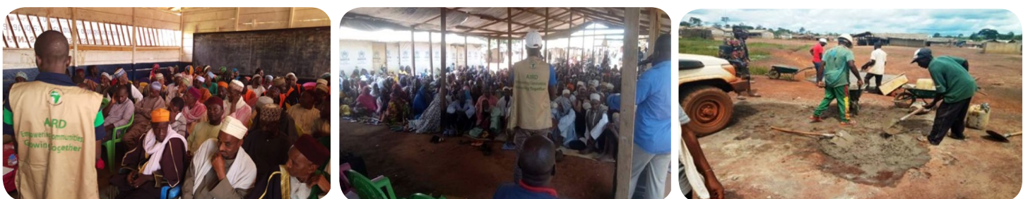
Gauche et centre: réunions du comité de gouvernance à Mbile et rencontre avec la communauté de réfugiés du camp de Timangolo. À droite: Achèvement des activités de drainage sur le site de Lolo

Grâce au CCM, la vie des réfugiés dans les camps peut être considérablement améliorée et ils peuvent dépasser leur survie de base et commencer à saisir les opportunités de croître et de prospérer. L'AIRD espère soutenir les personnes déplacées tout au long de ce voyage.